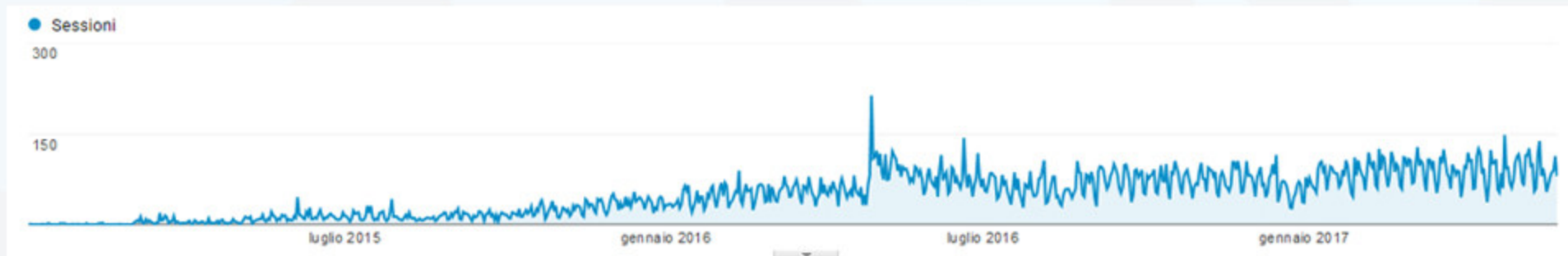
Analytics - La crescita dei visitatori (2014-2017)